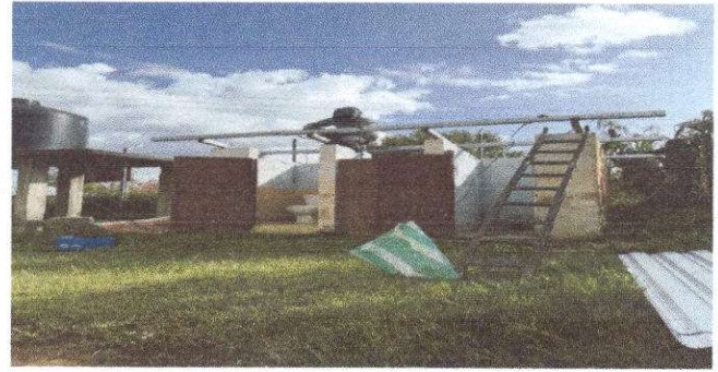
Foto 2: Sustitución de estructura de soporte de madera por metal (3x2 pulgadas)