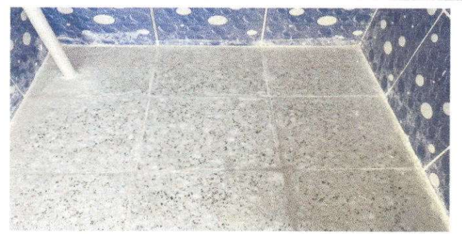
Foto 6: Sustitución de piso de torta de concreto por piso ceramico

Observación: Si es necesario se pueden agregar hojas adicionales y actualizar el número de hojas.