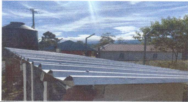
Foto1: Sustitución de lamina por lamina troquelada aluzinc calibre 26