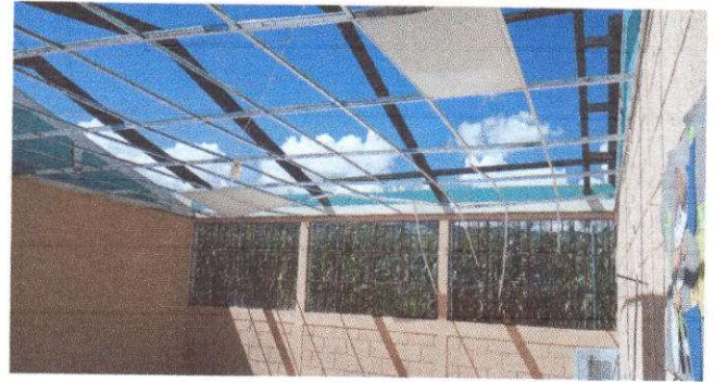
Foto 2: Sustitución de estructura de soporte de madera por metal (3x2 pulgadas)