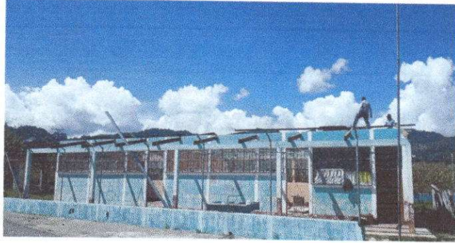
Foto1: Sustitución de lamina por lamina troquelada aluzinc calibre 26