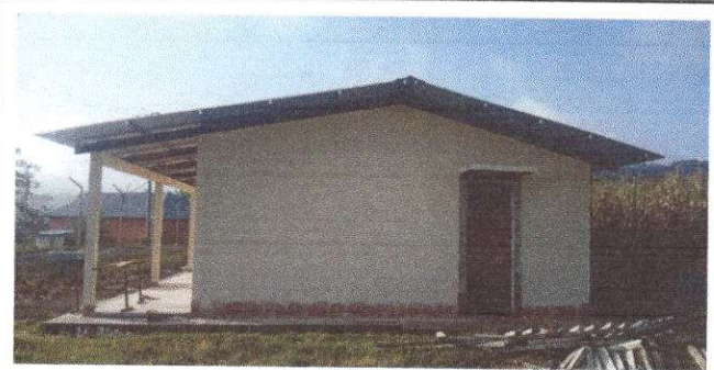
Foto 6: Mantenimiento estructura (lijado, cambio de tubo, cepillado, sujeciones, aplicacion pintura)

Observación: Si es necesario se pueden agregar hojas adicionales y actualizar el número de Hojas.